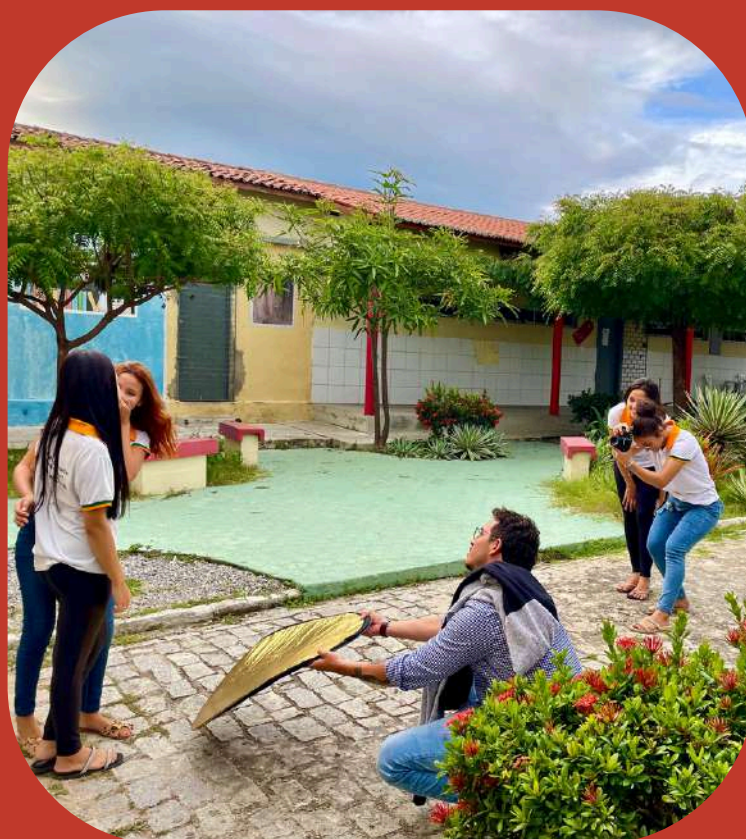
(Acervo pessoal: Artista, Presente! - 2023)