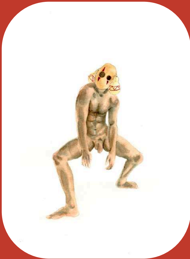
(Acervo pessoal: Artista Albuquerque - 2022)

SEGUEM ALGUNS LINKS DOS TRABALHOS DESENVOLVIDOS: