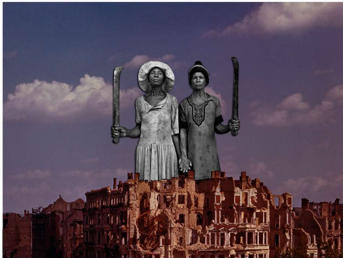
“RESISTÊNCIA OU SORTE” - COLAGEM MANUAL - IGUATU-CE - 2017

SEGUINDO OS CAMINHOS ALQUIMISTAS NASCEM AS PRIMEIRAS COLAGENS, JÁ CARREGADAS DE FORÇA E RESISTÊNCIA DOS POVOS LATINO-AMERICANOS.