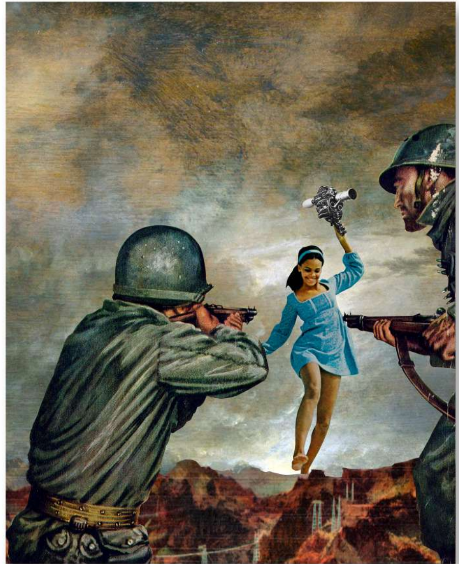
"NA MIRA"- COLAGEM DIGITAL - CAMPINA GRANDE-PB - 2018

O USO DAS COLAGENS SE TORNOU RECORRENTE NO FLUXO, PARA PROMOVER DISCUSSÕES SOBRE DIVERSOS TEMAS CONTEMPORÂNEOS.