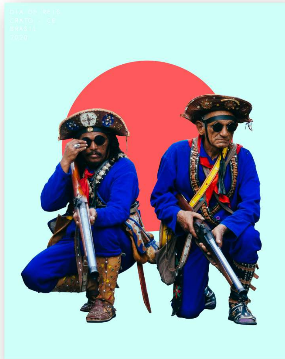
“DIA DE REIS” - COLAGEM DIGITAL- CRATO-CE - 2020

2020 OS TRABALHOS COMEÇAM PROCURANDO REAFIRMAR O PRINCIPAL OBJETIVO DO FLUXO, QUE É MARCAR A DISPUTA DA HISTÓRIA DA ARTE COM A IMAGEM DE VANGUARDA NORDESTINA.