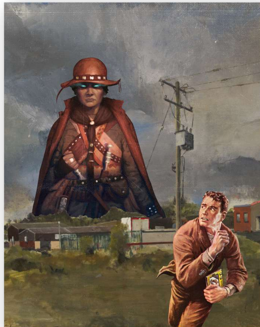
“DESAPROPRIAÇÃO” - COLAGEM DIGITAL - CARIRI-CE - 2019

PROCURANDO AS RELAÇÕES DOS POVOS NORDESTINOS COM OS OUTROS POVOS LATINO-AMERICANOS AS REFERÊNCIAS ARMORIAIS TOMAM CADA VEZ MAIS ESPAÇO NA IMAGÉTICA DO FLUXO. UNINDO FORÇAS COM OUTRAS PESQUISAS QUE NASCEM NO MESMO PERÍODO, COMO O “FORRÓ DO PINGORÓ”.