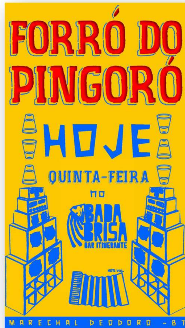
FLYER DE DIVULGAÇÃO DO “FORRÓ DO PINGORÓ” - FORTALEZA-CE - 2019