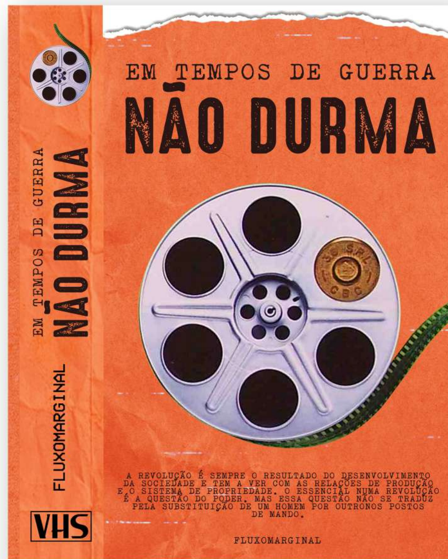
CAPA DO FILME “EM TEMPOS DE GUERRA, NÃO DURMA” FILME/MIXTAPE EXPERIMENTAL CAMPINA GRANDE - PB / FORTALEZA - CE 2018

OS EXPERIMENTOS COM CORTES PASSAM A FAZER PARTE DO PROCESSO DE CRIAÇÃO DE OUTRAS LINGUAGENS ARTÍSTICAS. ABRINDO CAMINHOS PARA PRODUÇÕES COMO “EM TEMPOS DE GUERRA, NÃO DURMA”.