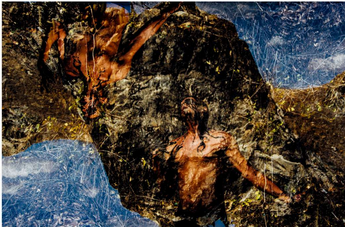
“UM CORPO JOGADO AO MAR”- MULTIPLA EXPOSIÇÃO - JUCÁS-CE - 2016

MISTURANDO REFERÊNCIAS DENTRO DE UM CALDEIRÃO NORDESTINO O FLUXO DA INÍCIO AO ESTUDO DA ALQUIMIA VISUAL.