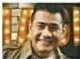
"Confiei aos meninos o meu primeiro DVD em