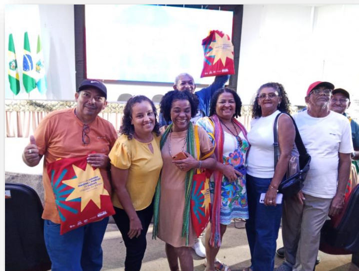
Homenagem do Projeto Canto de Reis na cidade de Juazeiro do Norte em 2025