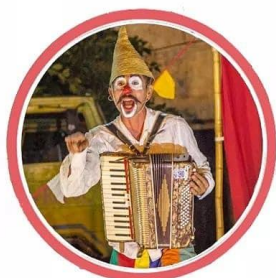
Espetáculo Circo Só 17h30