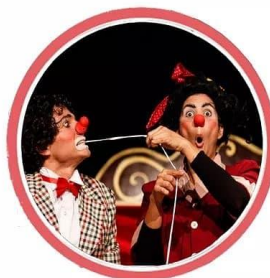
Espetáculo Pedra no Sapato 20h

Rua Ratisbona - Centro Informações: (88) 3523 4444 Público Educar SESC