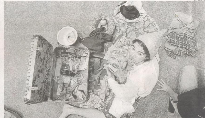
A Companhia de Teatro Popular Tem Sim Sinhô! resgata a tradicional cultura popular brasileira através do espetáculo 'O Circo Só'

A companhia Tem Sim Sinhô! é um grupo de teatro popular que nasceu a partir da vivência dos artistas com mestres, brincantes e artistas populares por todo o Brasil, através da experiência e prática de técnicas circenses e musicais. De forma itinerante, passando a cada dia por um lugar diferente do país, a companhia vive ex-