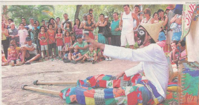
A companhia teatral encanta crianças e adultos usando elementos do circo para contar histórias da cultura popular

TEATRO ■ A magia do circo será a atração de hoje, no Campo de São Bento, a partir das 10h