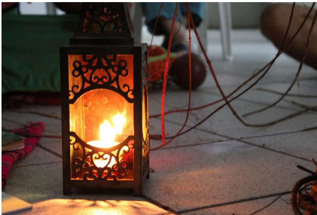
Vídeo performance Voa Beija-flor (Sobral, 2024)